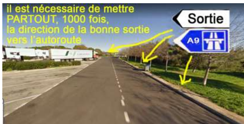
Photo ci-dessous de l'aire de Margueritte, devant le parking poids lourd : il n'y a pas de panneau « sortie » là où il faudrait.

Et pour éviter d'emprunter la mauvaise bretelle, prendre, comme indiqué ci-avant, Les 7 mesures pour une meilleure signalisation