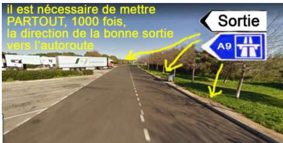
Photo ci-dessous de l'aire de Margueritte, devant le parking poids lourd : il n'y a pas assez de panneau "sortie" là où il faudrait

Et il faut en plus, bien sûr, bien signaler l'interdiction d'emprunter la mauvaise bretelle, et pour cela, prendre comme indiqué ci-avant, Les 7 mesures pour une meilleure signalisation :