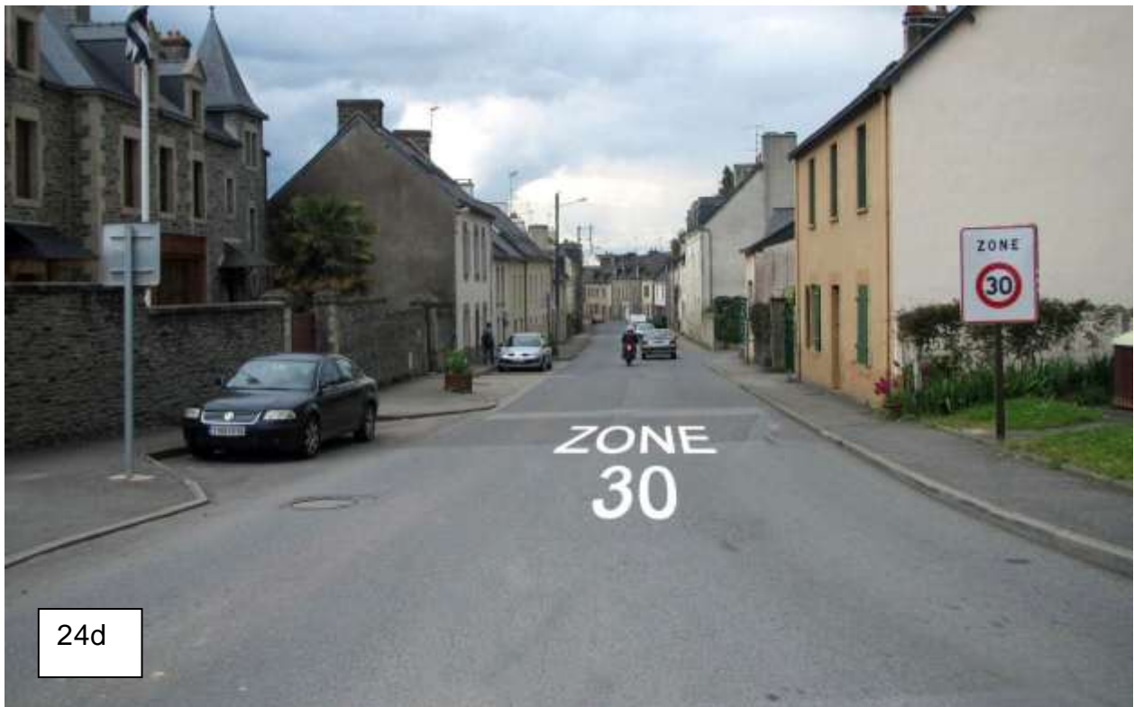
Ci-dessus, marquage réglementaire : ZONE 30 en entier

L'arrêté du 23 septembre 2015 a modifié l'IISR (Instruction interministérielle sur la signalisation routière) en précisant qu'il est possible de marquer "zone 30" sur la chaussée en entrée de zone 30, en plus du panneau réglementaire (photo 24d) . C'est donc "ZONE 30" en entier qu'il convient de marquer au sol et pas seulement 30. Néanmoins, avant l'arrêté de 2015, beaucoup de villes avaient déjà marqué l'entrée par le simple "30" : ci-dessous : exemple la photo 24e1 de Lorient, entouré de pavés blancs, d'autres ont peint au sol comme 24e2 Nantes.